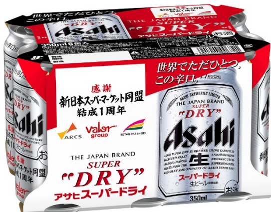
< 6缶パック >