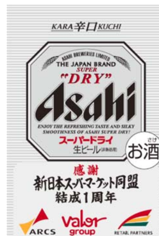
< 商品ラベル >