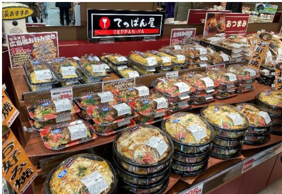
▲デリカコーナーの鉄板調理メニュー