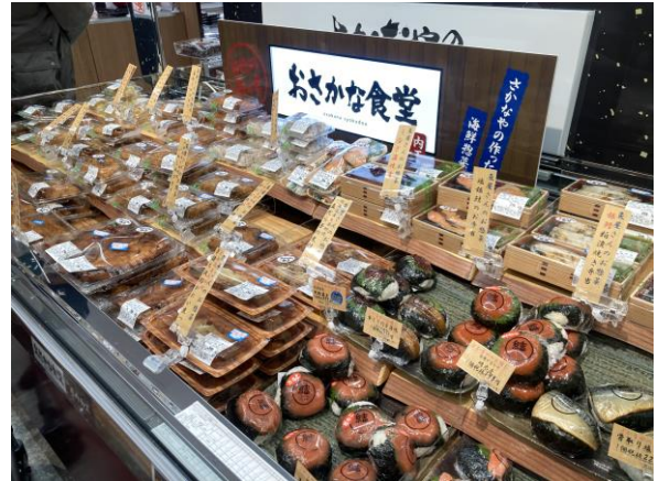
▲水産コーナーの「おさかな食堂」