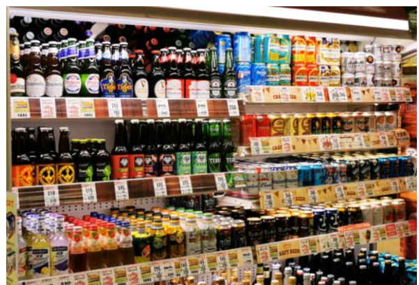
▲お酒コーナーのクラフトビール