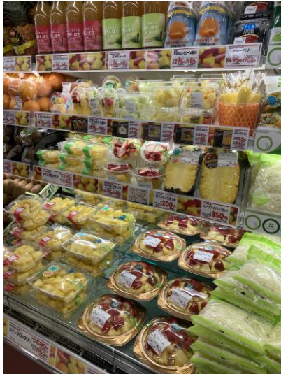
▲青果コーナーのカットフルーツ