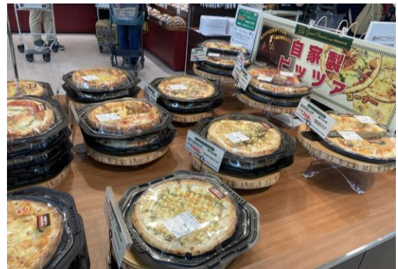
▲ベーカリーのピザコーナー