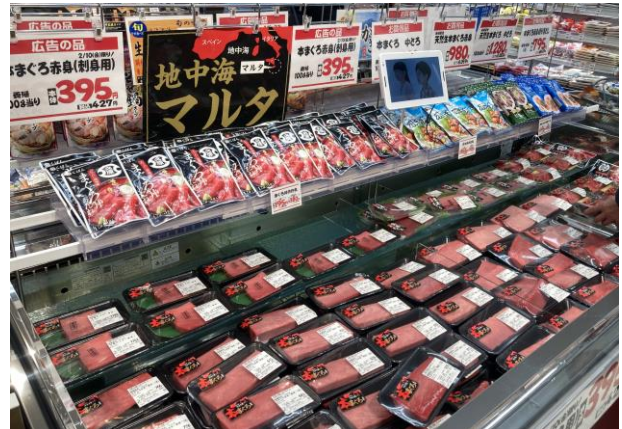
▲水産コーナーの「地中海産本まぐろ」