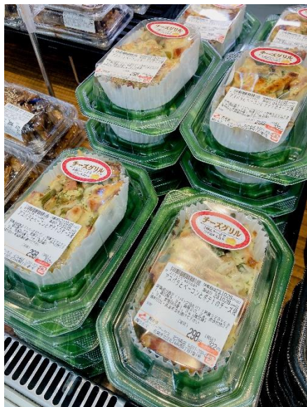
▲デリカコーナーの「アスパラとベーコンとポテトのチーズ焼」