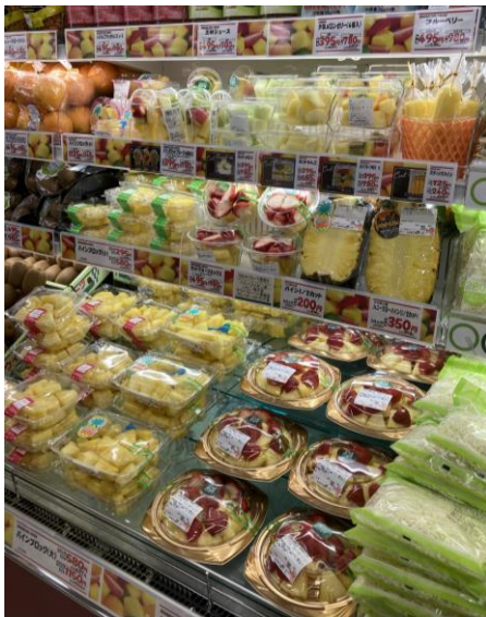
▲青果コーナーのカットフルーツ