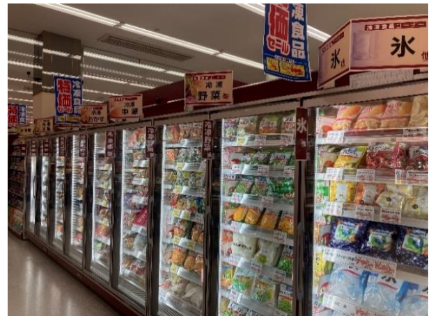
▲冷凍食品コーナーにはリーチインケースを導入