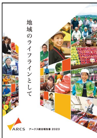
▲統合報告書日本語版

アークスグループは今後とも「地域のライフラインとして」、よりお客様の近くに、役に立つ存在となることを通じて企業価値創造に取り組んでまいります。