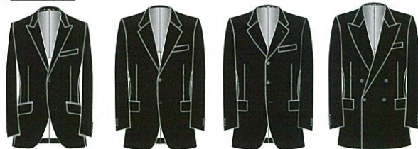
シングル2個釦 シングル2個釦 シングル3個釦 ダブル4個釦1ツ掛け

ヤングビジネスマンゾーン タイトなシルエット 短めの上着丈 細めのパンツ 細めの衿巾