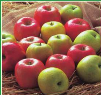
青森県産 サンふじりんごと王林