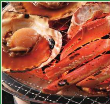
海鮮浜焼きセット