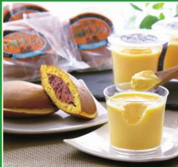
「乳蔵」北海道プリン&十勝生どら