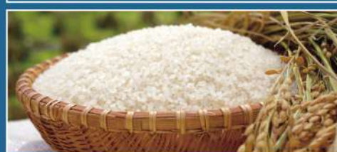
福井県産 いちほまれ