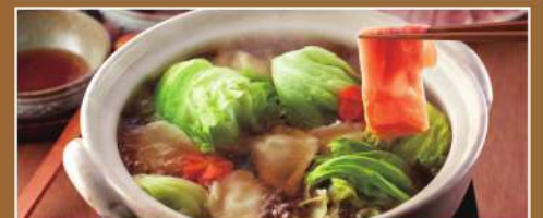
「博多華味鳥」味わいしゃぶしゃぶセット