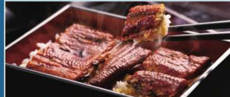
うなぎ割烹「一慎」蒲焼